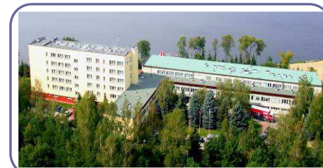
Отель Rewita WDW Rynia

От имени организаторов приглашаем вас принять участие в Конференции, гарантируем приятную атмосферу, высокий научный уровень, чтобы отдохнуть и расслабиться среди лесов на зегжинском озере.