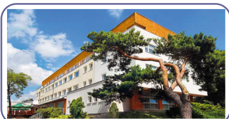
Учебный Центр „Allianz”

Высокое качество гостиничных услуг и отличное место, способствуют физической активности и отдыха. В/у Отели находящиеся в удобном расположении, на восточном берегу Зегжинского Залива - в 30 км от центра Варшавы, окруженные обширным, огороженным лесным комплексом обеспечат нашим Гостям тишину и комфорт во время отдыха.