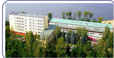
Ośrodek Rewita WDW Rynia

W imieniu organizatorów serdecznie zapraszamy do udziału w Konferencji, zapewniamy miłą atmosferę, wysoki poziom naukowy, relaks i odpoczynek wśród lasów nad Zalewem Żegrzyńskim.