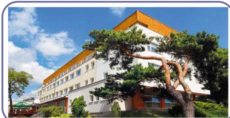
Ośrodek Szkoleniowy „Allianz”

Wysokiej jakości usługi hotelowe oraz doskonałe miejsce sprzyjają aktywności fizycznej i relaksowi. W/w Hotele położone są w dogodniej lokalizacji na wschodnim brzegu Zalewu Żegrzyńskiego - 30 kilometrów od centrum Warszawy, otoczone rozległym, ogrodzonym kompleksem leśnym zapewni naszym Gościom ciszę i komfort wypoczynku.