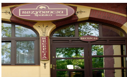
Rezydencja Spalska, Spała, ul. Wojciechowskiego 15

Zarezerwujemy Państwu podczas konferencji nocleg i wyżywienie. Nocleg dla Gości konferencji zarezerwowaliśmy w hotelu Mościcki**** Resort & Conference, Rezydencji Spalskiej, Spalskich Pokojach Gościennych-Carska Oranżeria. Jakość świadczonych usług w połączeniu z naturalnym pięknem przyrody Spalskiego Parku Krajobrazowego pozwolą odzyskać optymizm, energię, siłę do dalszej pracy i równowagę psychofizyczną.