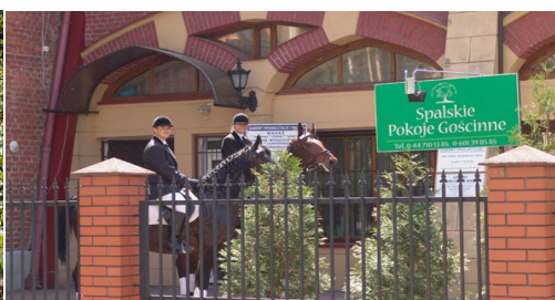
Spalskie Pokoje Gościinne-Carska Oranżeria 97-214 Spała, Wojciechowskiego 15