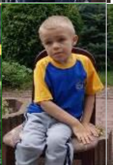
Dzieci i osoby chore, które czekają na lekarstwa